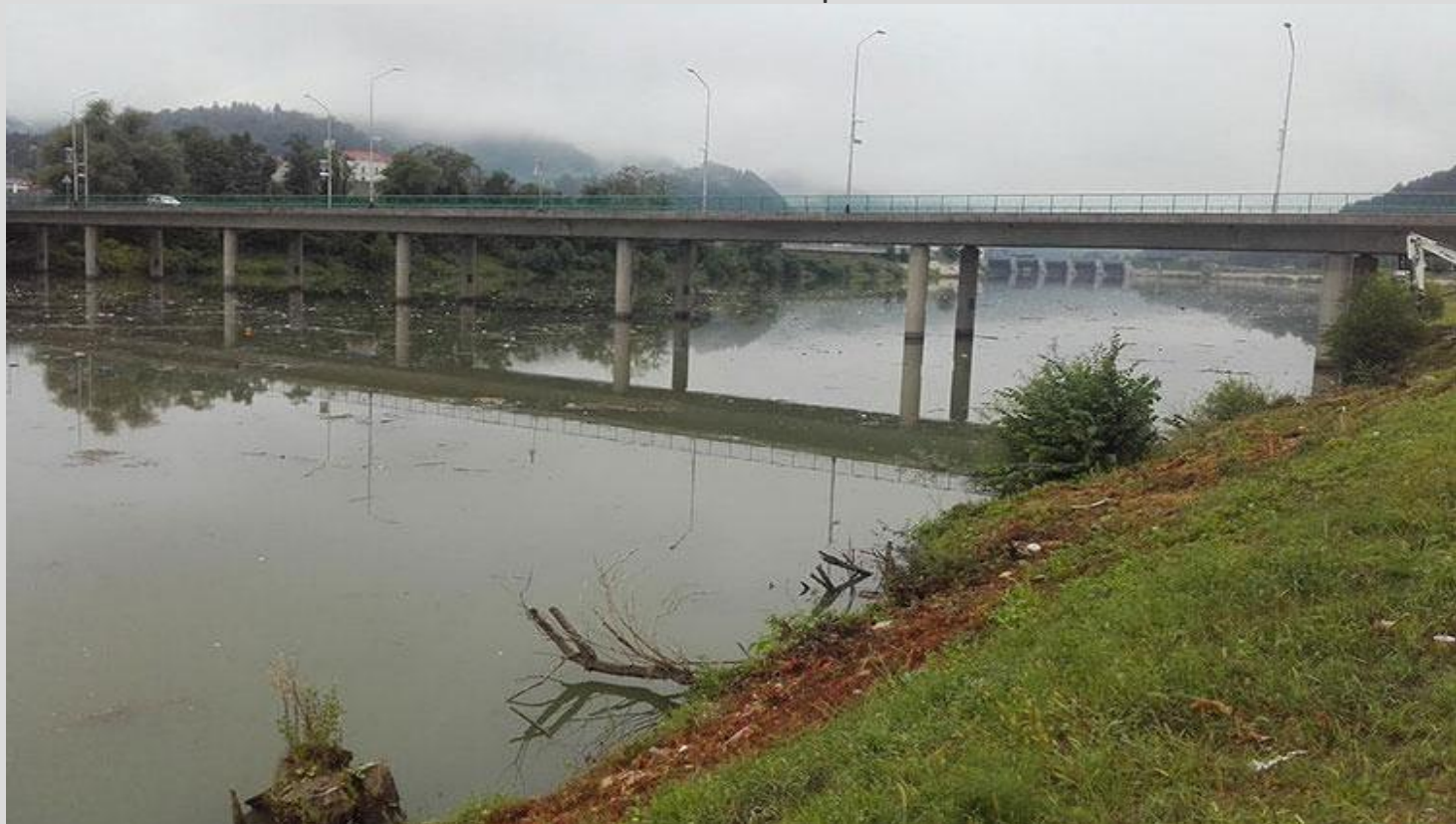
Žalosten prizor v reki Savi

V sodelovanju z raziskovalci iz drugih držav, smo prišli do podatka, da se voda na svoji poti skozi Republiko Hrvaško in naprej skozi Republiko Srbijo spreminja in je vse bolj onesnažena, s seboj nosi večje količine smeti, ki jih ljudje spuščajo v reko, kar bi bilo mogoče zaznati tudi pri nas.