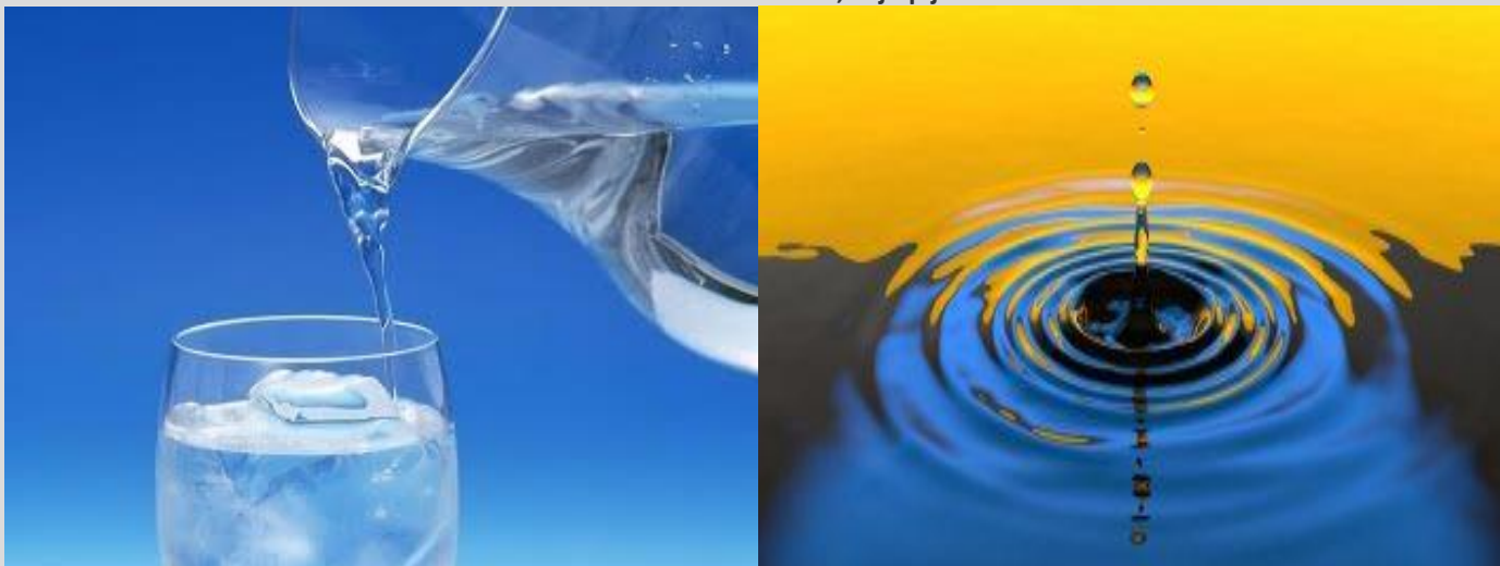
Slika 2: Pitna voda, ki jo pijemo

Človek in voda sta močno povezana, saj je približno dve tretjini človeškega telesa sestavljenega iz vode. Gre za ugotovitev, da je voda za človeka izrednega pomena, ker je del njegovih celic, medceličnega prostora in krvne plazme in je transportni medij za kisik, vitamine, minerale ter glukozo.