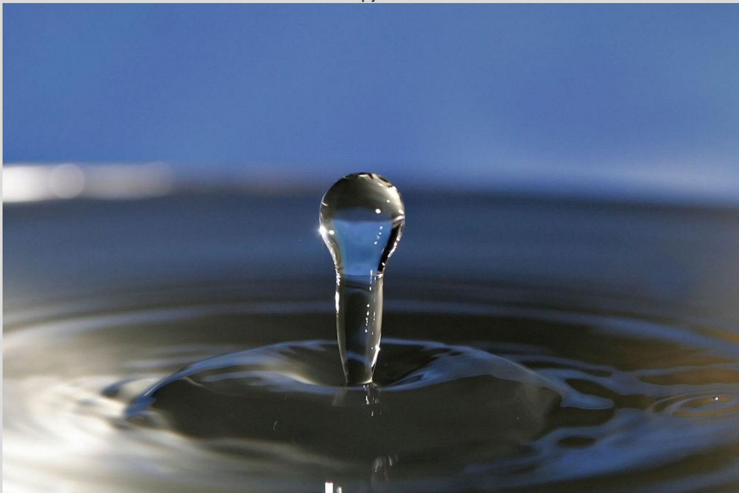
Slika 3: Čista kapljica vode v naravi